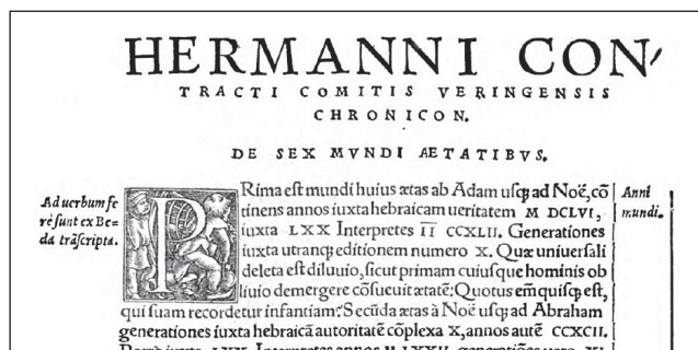
Fot. 1. Kronika H. Contractusa drukowana w En damus chronicon, 1512.

Kronika Świata Hermana jest więc jednym z najważniejszych źródeł do historii XI w., tym bardziej, że została napisana jasnym stylem i obiektywnym językiem. Jest możliwe, że została oparta na krytycznej rewizji wcześniejszej kroniki Szwabii (tzw. Chronicum Universale Suevicum , inaczej Epitome Sangallensis , do 1039).