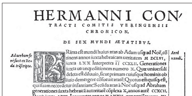
Fot. 1. Kronika H. Contractusa drukowana w En damus chronicon, 1512.

Kronika Świata Hermana jest więc jednym z najważniejszych źródeł do historii XI w., tym bardziej, że została napisana jasnym stylem i obiektywnym językiem. Jest możliwe, że została oparta na krytycznej rewizji wcześniejszej kroniki Szwabii (tzw. Chronicum Universale Suevicum , inaczej Epitome Sangallensis , do 1039).